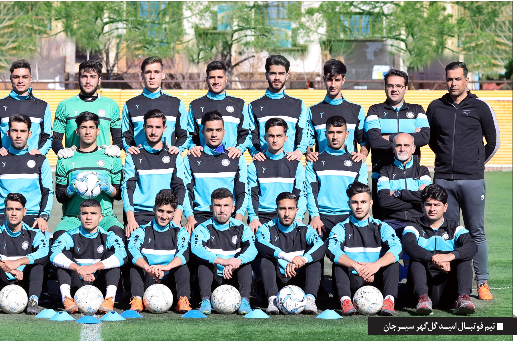
تیم فوتبال امید گل گهر سیرجان